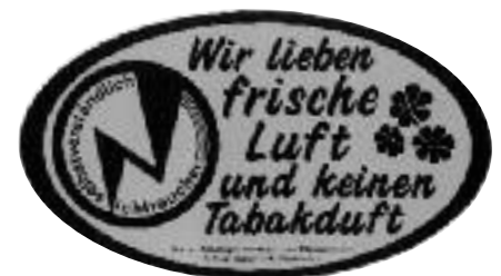
Aufkleber 11 x 8,5 cm, Best.-Nr. A/49, Farbe grün oder violett, 0,60 Euro.